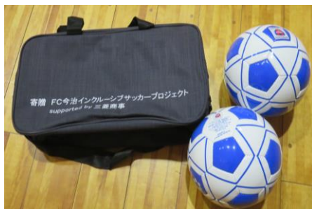
フラインドサッカーボール