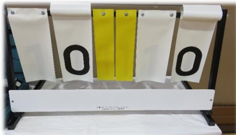
ポータブル得点板