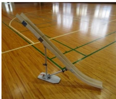
ランフ（ポッチャ用勾配具）