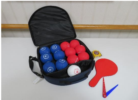
ポッチャボールセット（レフェリーキット付）