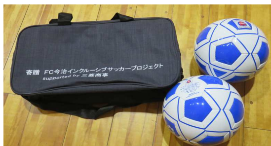
ブラインドサッカーボール