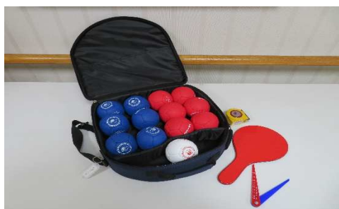
ポッチャボールセット(レフェリーキット付)