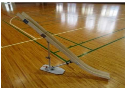
ランプ(ポッチャ用勾配具)