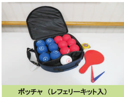
ポッチャ (レフェリーキット入)