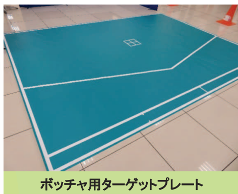
ポッチャ用ターゲットプレート