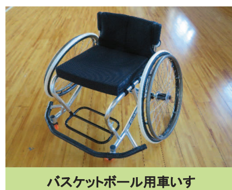
バスケットボール用車いす