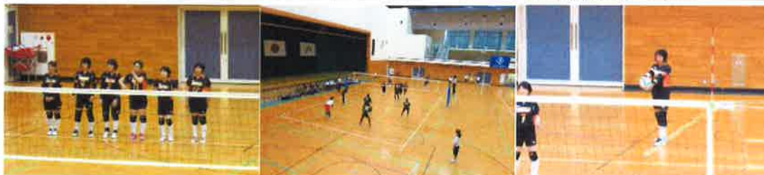
↑伊予市しおさい公園体育館で行われた、聴覚バレーボール大会の様子。