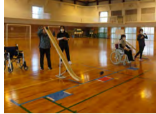
レクリエーションボッチャ