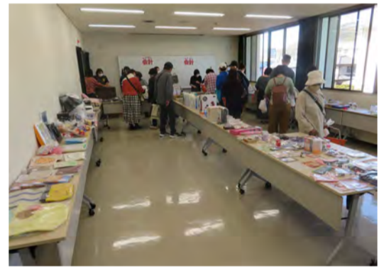
チャリティーバザー