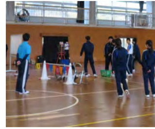
フライングディスク