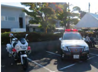
白バイ・パトカーに乗ろう！