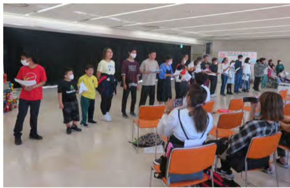
アート舞台芸術の発表