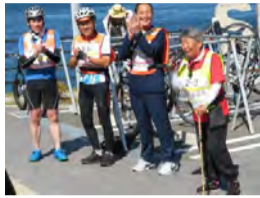
元気いっぱい笑顔でゴール!

お昼休憩はバラ公園。散策したりアイスを食べたりと、メンバー同士の交流も深まりました。