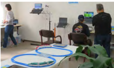
ICT機器展示&利用体験