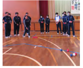
レクリエーションボッチャ