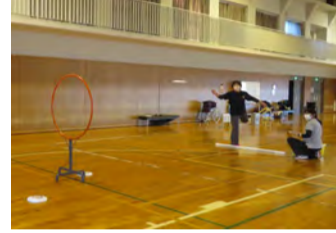
フライングディスク