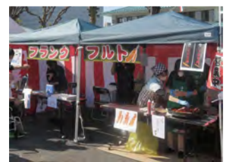
フルーツティー・ポップコーン・カレーパン・焼きそばからあげ・フライドポテト・甘とろ豚カレー……などなど