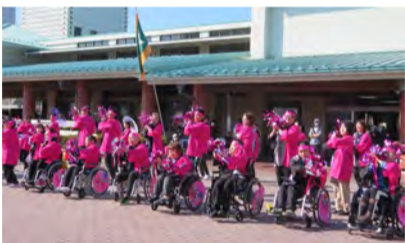
オープニングイベント 「ほほえみ連」による野球拳踊り