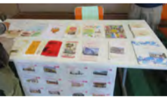
見て！知って！事業団！