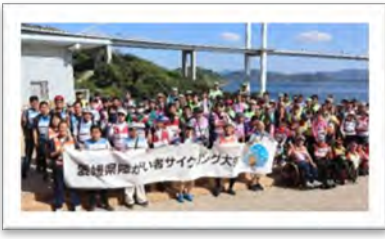
サンライズ糸山ウッドデッキテラスにて開会式