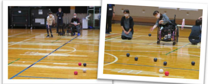
6/10 ボッチャ（愛媛県身体障がい者福祉センター）