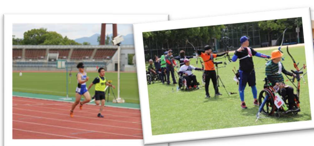
5/28 陸上、アーチェリー、卓球、フライングディスク（愛媛県総合運動公園） サウンドテーブルテニス（愛媛県身体障がい者福祉センター）