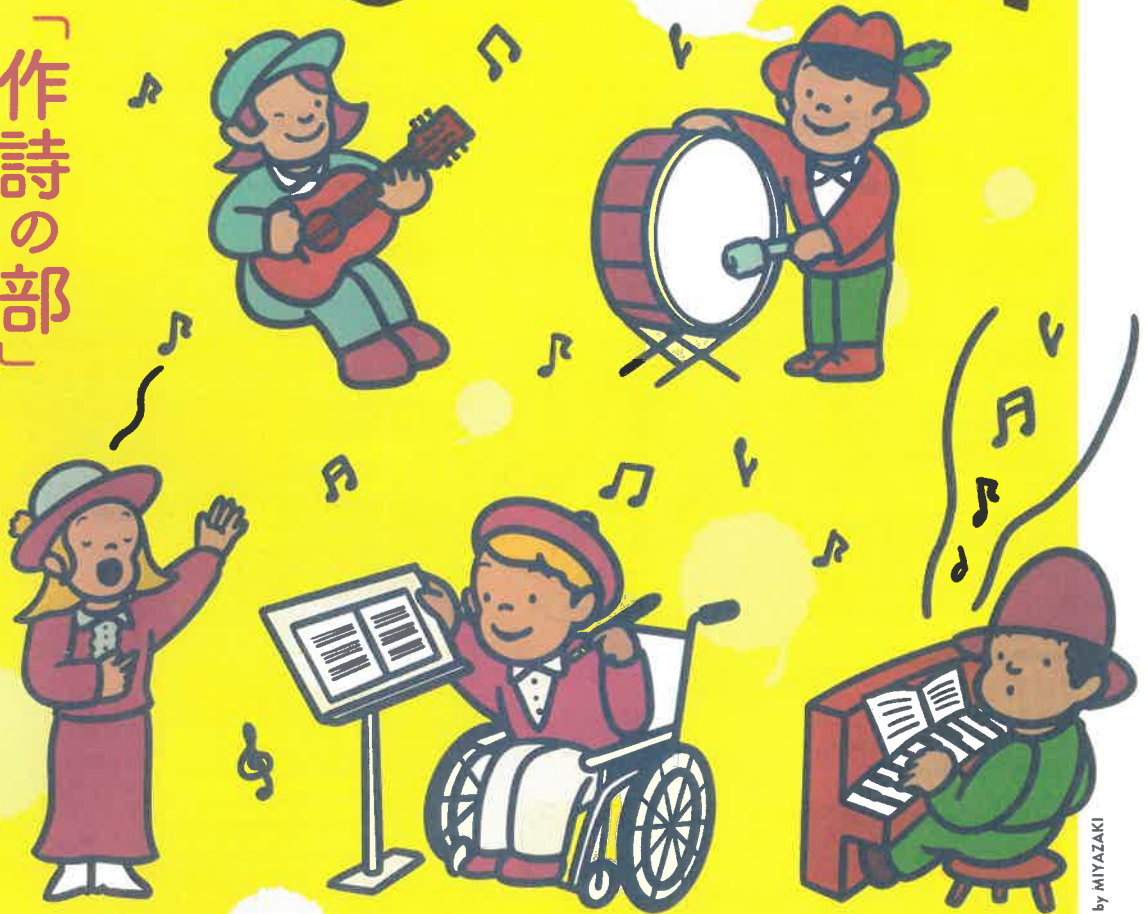
Illustration by MIYAZAKI