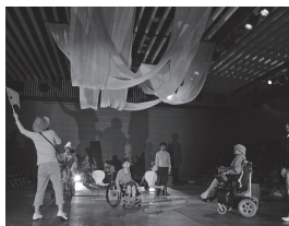
演劇公演「ゆかいアート村 はじまり物語」 7.10(土)・11(日) 三股町立文化会館

詳細やその他のイベントについては 「国文祭・芸文祭みやざき2020」 大会ホームページをご覧ください。