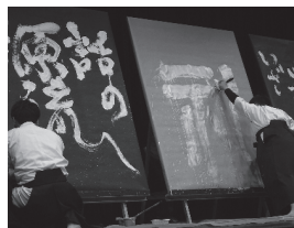
“こころ”のふれあうフェスタ2020 8.7(土) メディキット県民文化センター