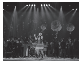
第40回わたぼうし宮崎コンサート2020 8.22(日) 宮崎市民文化ホール