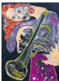
「トランペット奏者」 有重麻由 (絵画・デザイン)