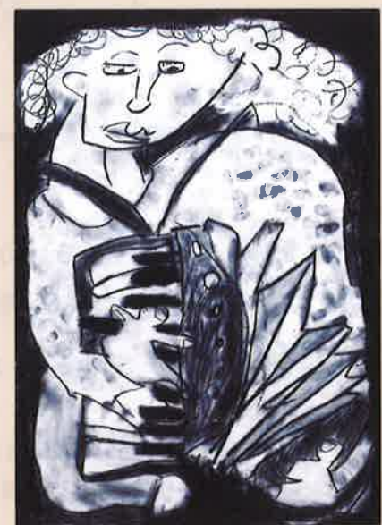
アコーディオンをひく女