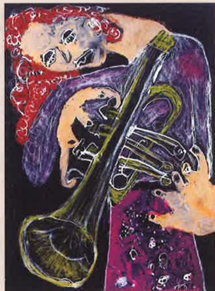
トランペット奏者

〈お問い合わせ先〉 TEL089-909-8508 愛媛県松山市祝谷二丁目10-12 株式会社シンプル内(mayutamago展覧会開催実行委員会まで)