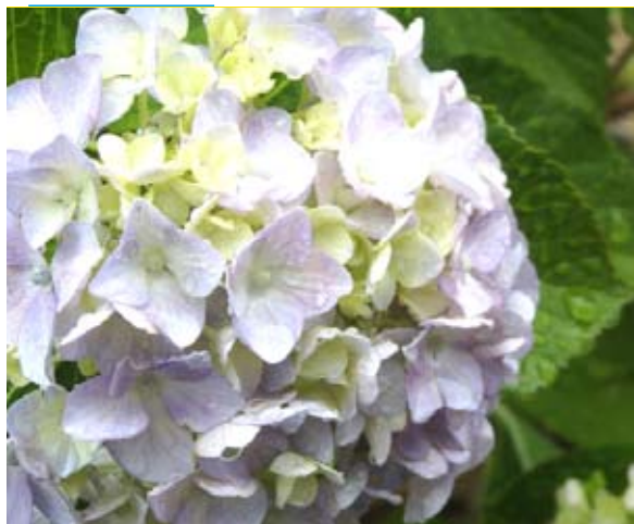
■ 梅雨を彩る清流園のアジサイ