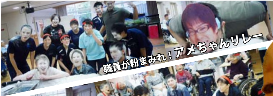
職員が粉まみれ！アメちゃんリレー