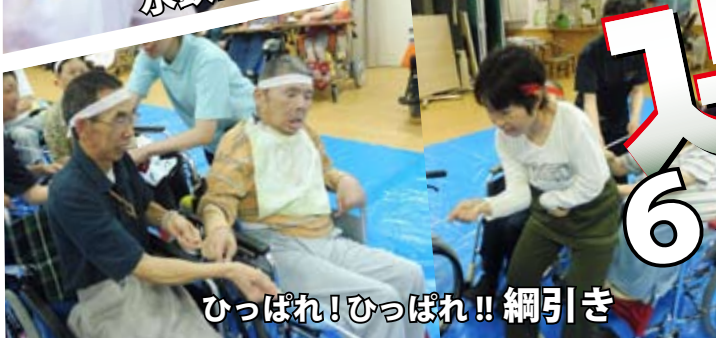
ひっぱれ！ひっぱれ！！綱引き