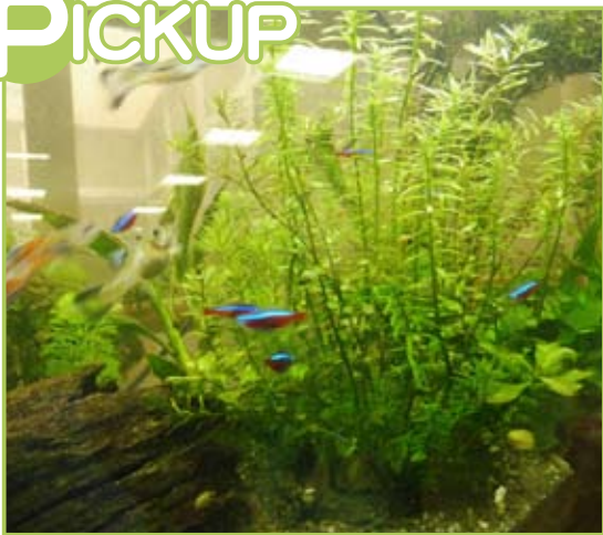
■水槽の中を動く熱帯魚たち