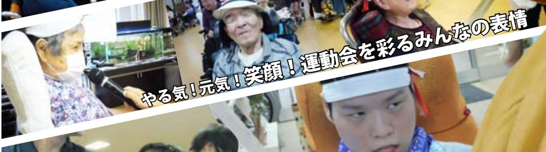
やる気！元気！笑顔！運動会を彩るみんなの表情