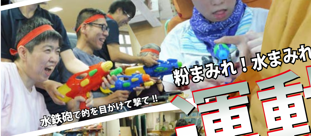
水鉄砲で的を目標けて撃て！！