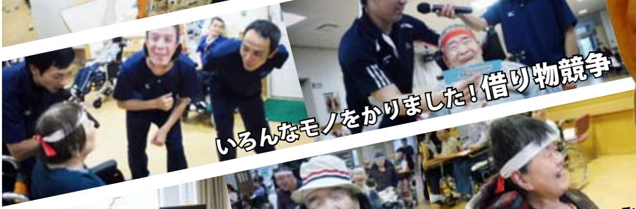
いろんなモノをかりました！借り物競争