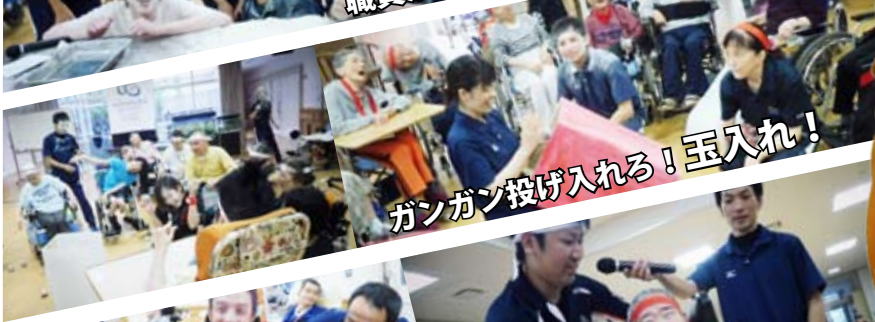
ガンガン投げ入れる！玉入れ！