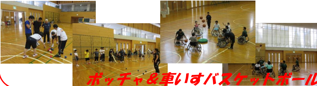
ボッチャ&車いすバスケットボール