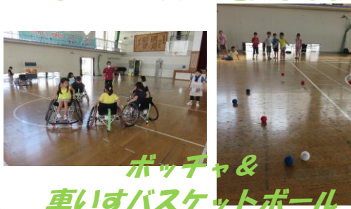
ボッチャ& 車いすバスケットボール