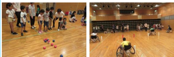
ボッチャ&スラローム