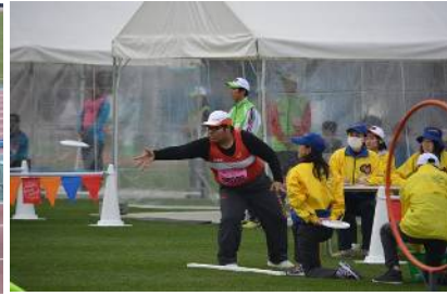
フライングディスク(アキュラシー)