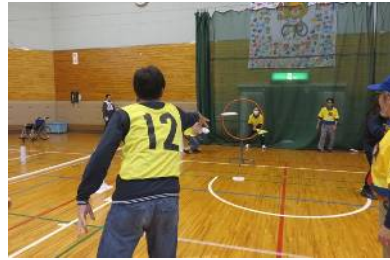
フライングディスク体験