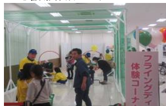
フライングディスク体験