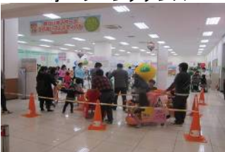
みきゃんとツーショット撮影会