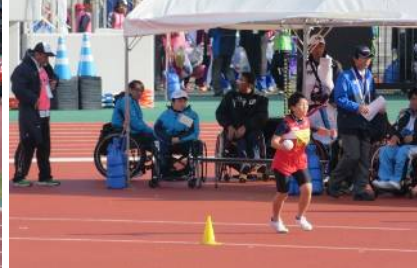
ソフトボール投げ