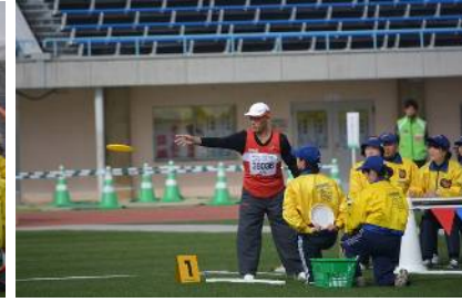
フライングディスク(ディスタンス)