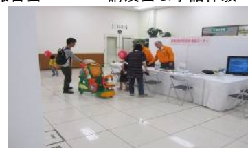
愛媛県歯科医師会相談コーナー