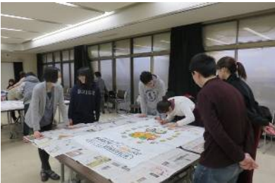
応援メッセージの作成