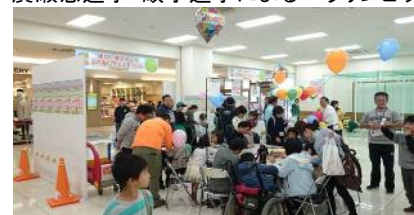
応援幕作成コーナー