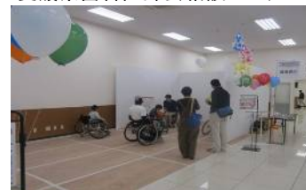
車いすバスケットボール体験